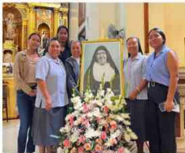
Las Hermanas de la Comunidad de Piura junto a los Líderes del MJS