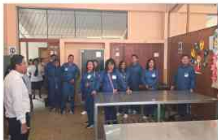
Personal de CETPRO Rosa de América conociendo a algunos de los talleres del CETPRO María Mazzarelli.

Durante esta jornada, compartimos valiosos espacios de aprendizaje e intercambio pedagógico, donde se abordaron experiencias exitosas, estrategias didácticas innovadoras y buenas prácticas en la formación técnica.