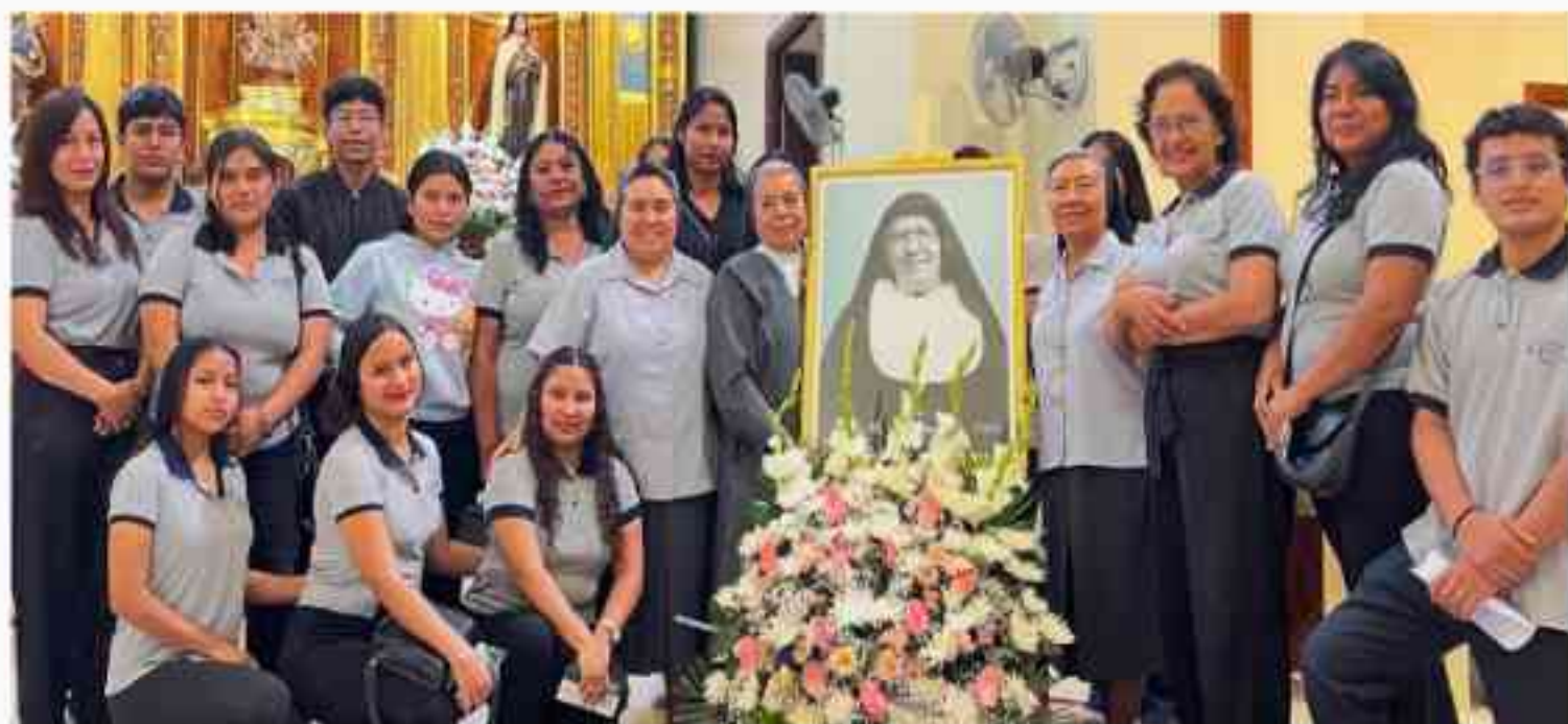
Las Hermanas de la Comunidad de Piura junto a los estudiantes del CETPRO María Mazzarelo

Su vida nos inspira a vivir con fe, esperanza y amor al prójimo.