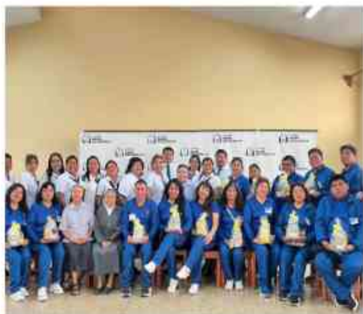
Las hermanas de la Comunidad Mazzarelli y los trabajadores del CETPRO Rosa de América.

Este encuentro permitió fortalecer los lazos interinstitucionales y reafirmar nuestro compromiso común con una educación técnica de calidad, humana y transformadora .