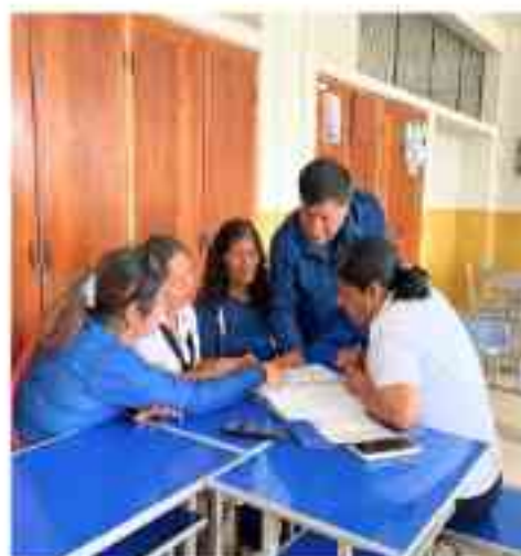
Docentes del CETPRO María Mazzarelli y CETPRO Rosa de América juntos compartiendo experiencias pedagógicas.