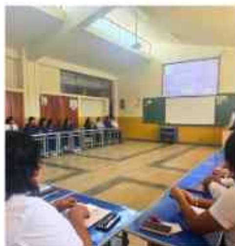
CETPRO María Mazzarelli y CETPRO Rosa de América iniciando la jornada de intercambio.