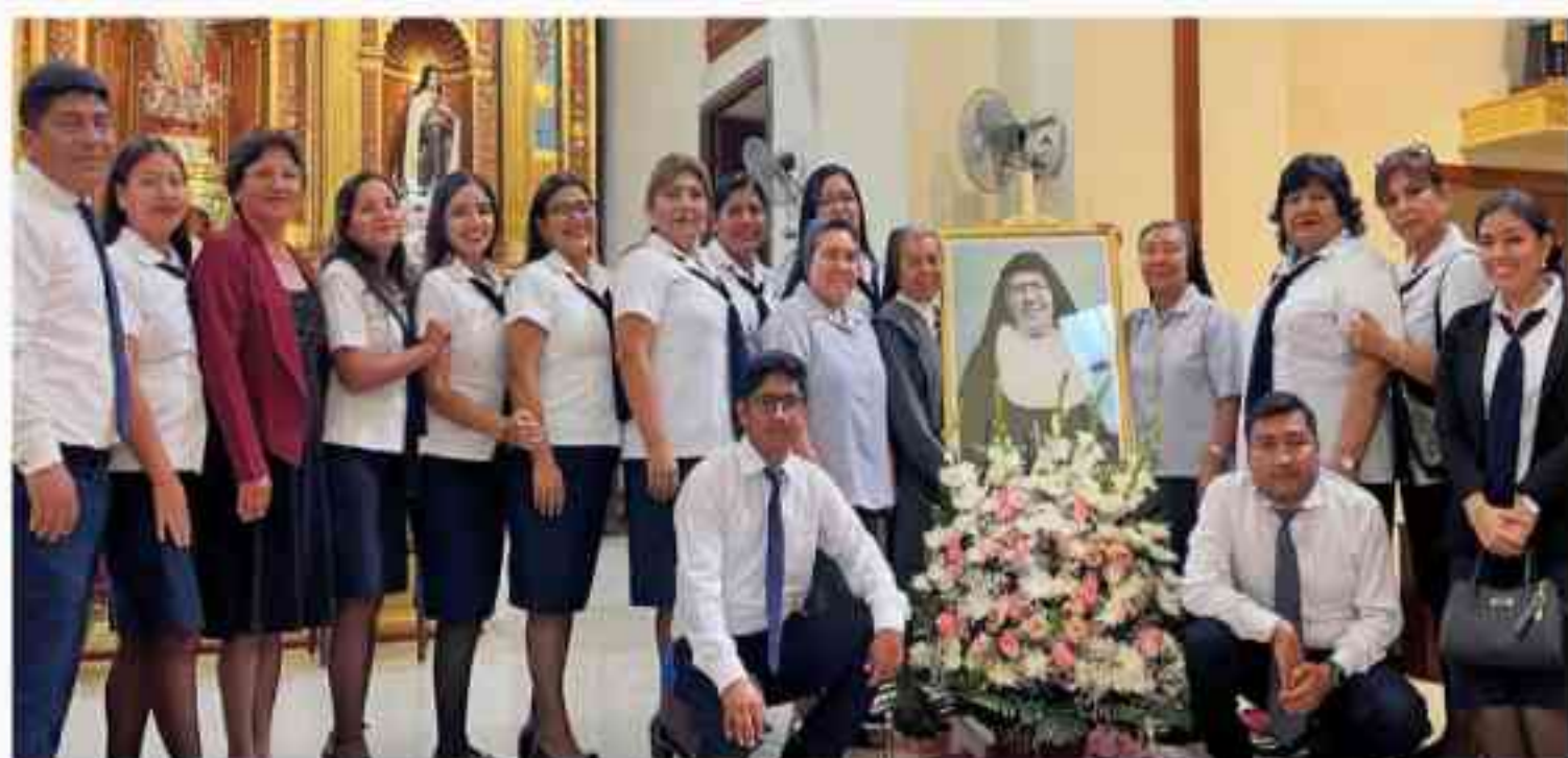
Las Hermanas de la Comunidad de Piura junto a la Comunidad Mazzarellina, conformada por los docentes y administrativos del CETPRO María Mazzarello.

Hijas de María Auxiliadora, Salesianos, comunidad educativa del CETPRO María Mazzarello, exalumnos e invitados nos unimos en acción de gracias por esta hija predilecta de la Iglesia , testimonio vivo de entrega, amor misionero y servicio a los más necesitados.