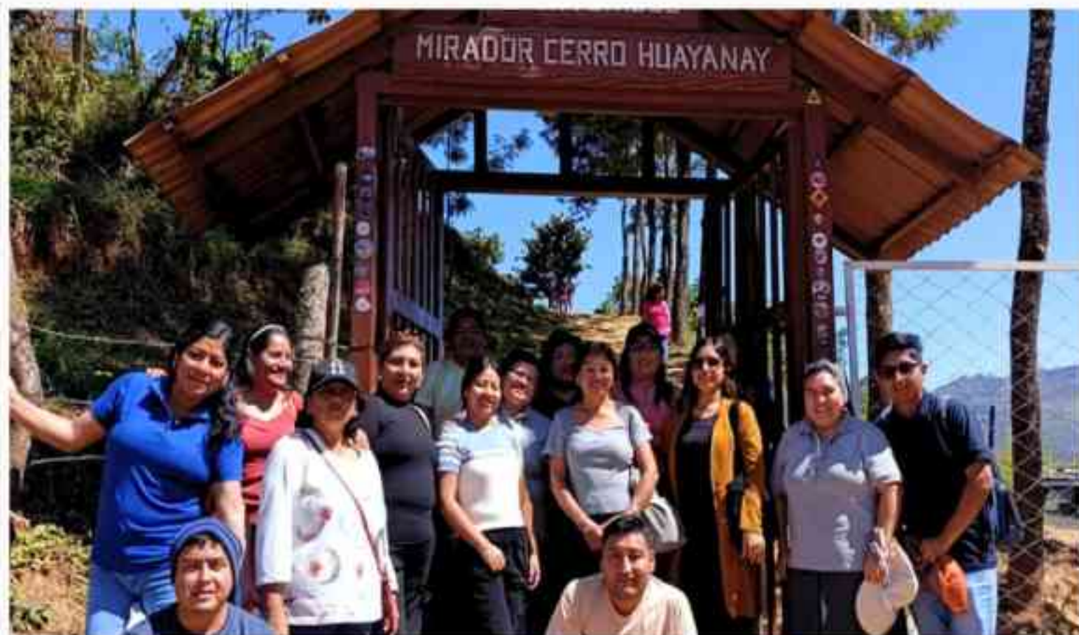
La Comunidad Educativa de Piura reunida en el Mirador del Cerro Huayanay.

Durante este día también disfrutaron de la exquisita gastronomía típica de la sierra piurana. Más allá del paseo turístico, esta jornada permitió fortalecer los lazos de fraternidad, compartir momentos de alegría y renovar energías para iniciar con entusiasmo el nuevo semestre.