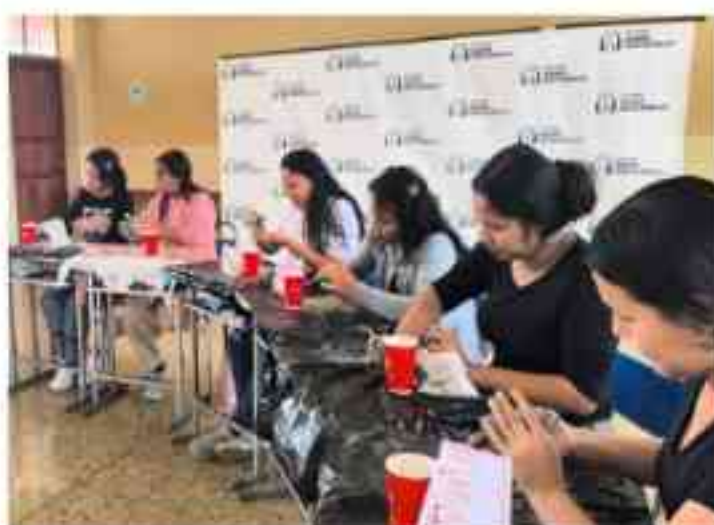
Nuestras jóvenes moldeando los dones que Dios les ha dado de manera simbólica.