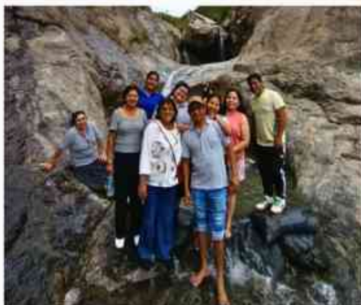
Nuestra Comunidad Educativa en los Peroles de Canchaque

El viernes 08 de agosto, la Comunidad Educativa de Piura realizó su paseo de confraternidad, como antesala al inicio del segundo semestre académico. El destino elegido fue la encantadora ciudad de Canchaque, en la sierra de Piura. Durante la visita, la Comunidad Educativa tuvo la oportunidad de recorrer algunos de los principales atractivos turísticos de la zona, como el Mirador del Cerro Huayanay, desde donde se aprecia un paisaje majestuoso, y los refrescantes Peroles.