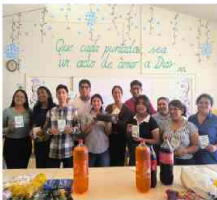
Nuestros catequistas en un compartir celebrando sus cumpleaños.

El domingo 17 de agosto compartimos una jornada llena de alegría y fraternidad junto a nuestros queridos catequistas y los niños de primera comunión. Celebramos con entusiasmo el Día del Niño y el cumpleaños de nuestro amado padre Don Bosco, a través de dinámicas y juegos que fortalecieron la unión y la alegría de nuestra comunidad. La jornada culminó con un sencillo pero significativo compartir en honor a los catequistas que celebraron su cumpleaños entre los meses de enero y julio.