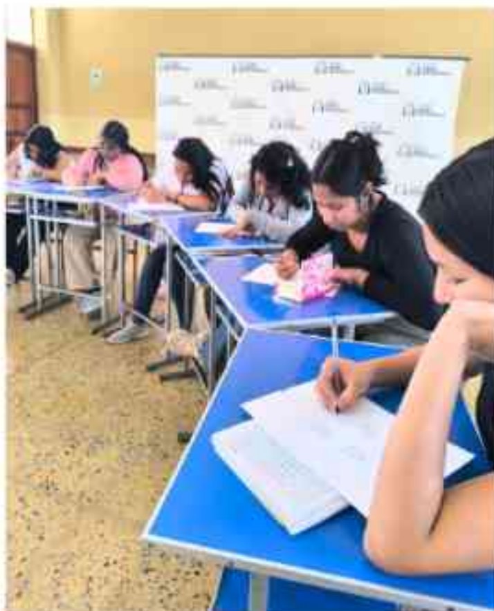
Nuestras jóvenes elaborando su proyecto de vida