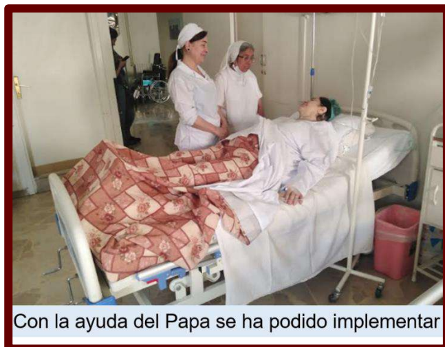
Con la ayuda del Papa se ha podido implementar

Gracias a Papa Francisco, por medio del Nuncio Apostólico de Siria, El Hospital está abierto, se ha creado un proyecto de ayuda a las personas que necesitan ser operadas y no tienen posibilidades de pagar, ya vamos por el 3º año; incluso hemos podido comprar medicina e instrumento sanitario, renovar las historias clínicas. La Providencia nos acompaña para ayudar.