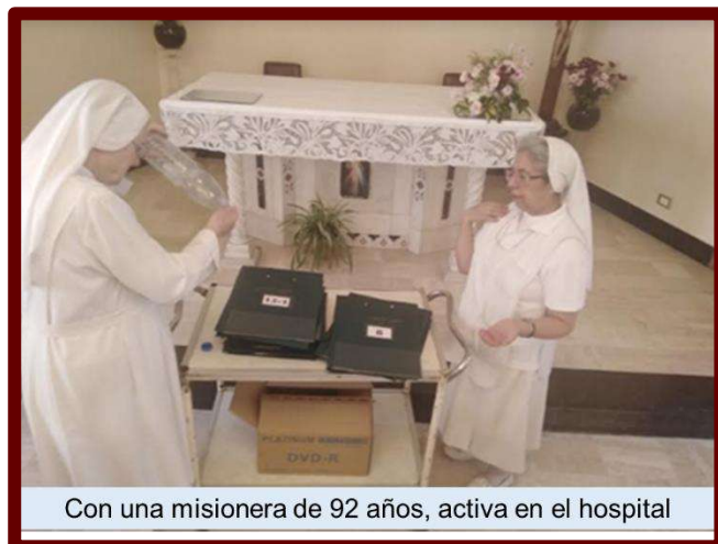
Con una misionera de 92 años, activa en el hospital

Conseguimos renovar algunas camas clínicas. Cada mañana antes de la misión en cada servicio iniciamos con la oración del Padre Nuestro y Ave María, en un pequeño ambiente.