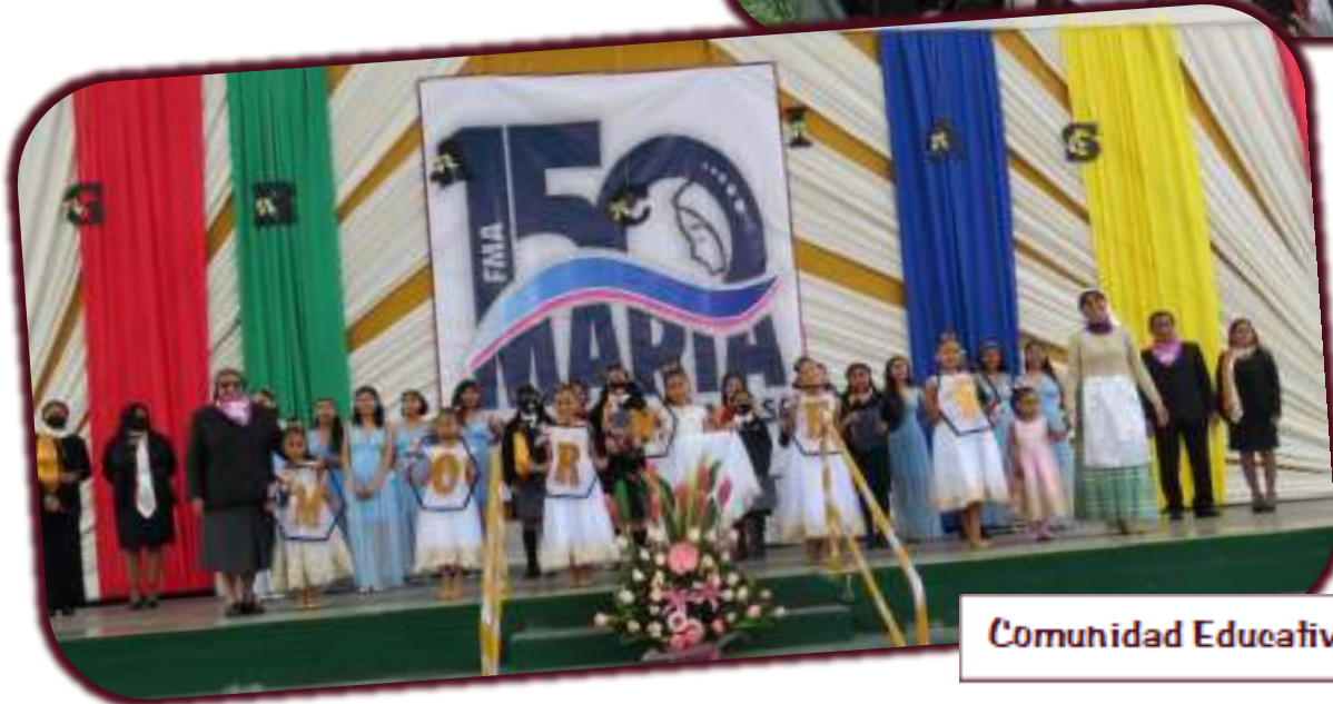
Comunidad Educativa do Chosica