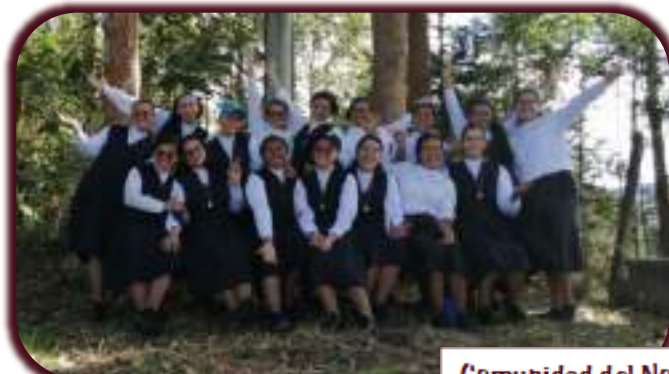
Comunidad del Noviciado San José