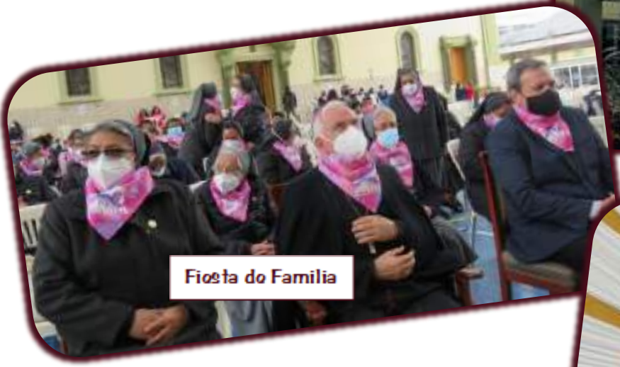
Fiesta do Familia