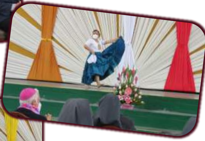
Presentación de las Exalumnas