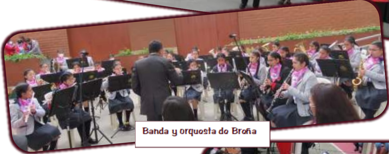
Banda y orquesta do Broña