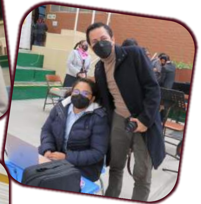
Rostros y encuentros