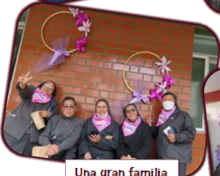
Una gran familia