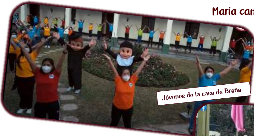
Jóvenes de la casa de Breña