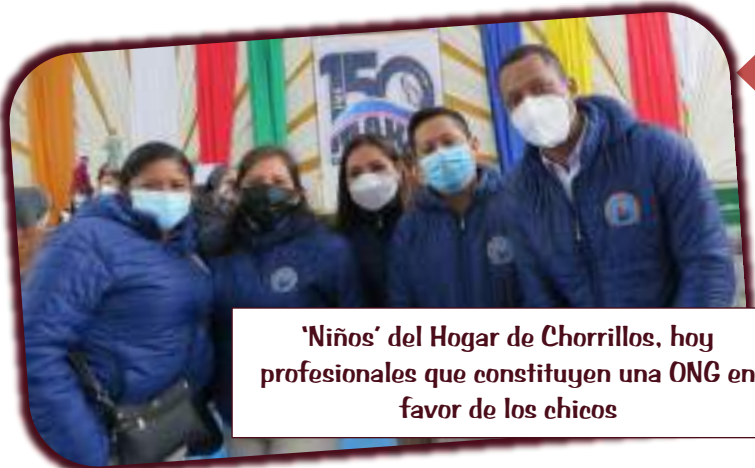
'Niños' del Hogar de Chorrillos, hoy profesionales que constituyen una ONG en favor de los chicos