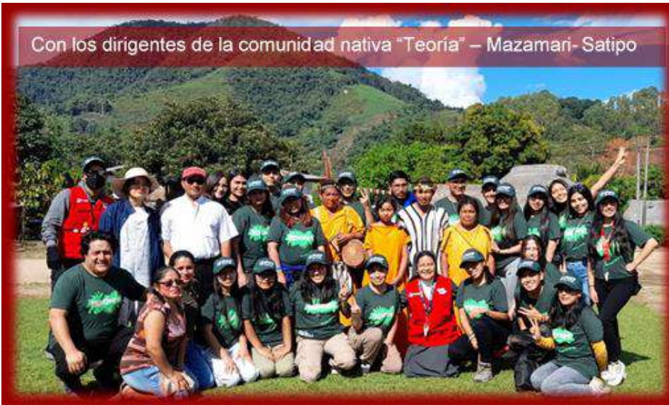
Con los dirigentes de la comunidad nativa "Teoría" – Mazamari- Satipo

Sin duda alguna fue un gran desafío para todos los jóvenes de misiones universitarias, más aún tratándose de una experiencia intercultural, durante 10 días en espacios totalmente distintas a las que solemos frecuentar como son las familias de las ollas comunes en San Juan de Lurigancho (Lima).