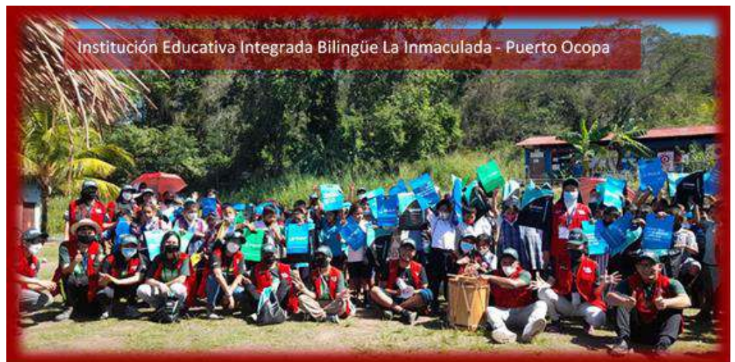
Institución Educativa Integrada Bilingüe La Inmaculada - Puerto Ocopa

Aterrizamos un poco nuestras expectativas cuando el Señor nos habló a través del Evangelio del día domingo que llegamos a Mazamari – Satipo: «te preocupas y agitas por muchas cosas; y hay necesidad de pocas, o mejor; de una sola». Así empezó nuestra misión, invitándonos a tener muy en cuenta una sola cosa: anunciar el Reino de Dios, poniendo cada uno de los dones que se nos ha otorgado en el servicio a los niños, jóvenes y familias de cada comunidad nativa que visitábamos, en los intercambios de experiencias académicas, artísticas y espirituales; en el compartir fraterno entre misioneros, siendo disponibles y flexibles cuando era necesario; en el desprendimiento de uno mismo para saber adaptarse a las necesidades que la misión nos exigía. Todos los