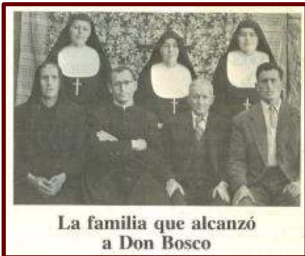
La familia que alcanzó a Don Bosco