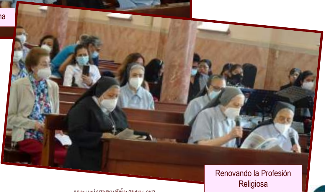
Renovando la Profesión Religiosa