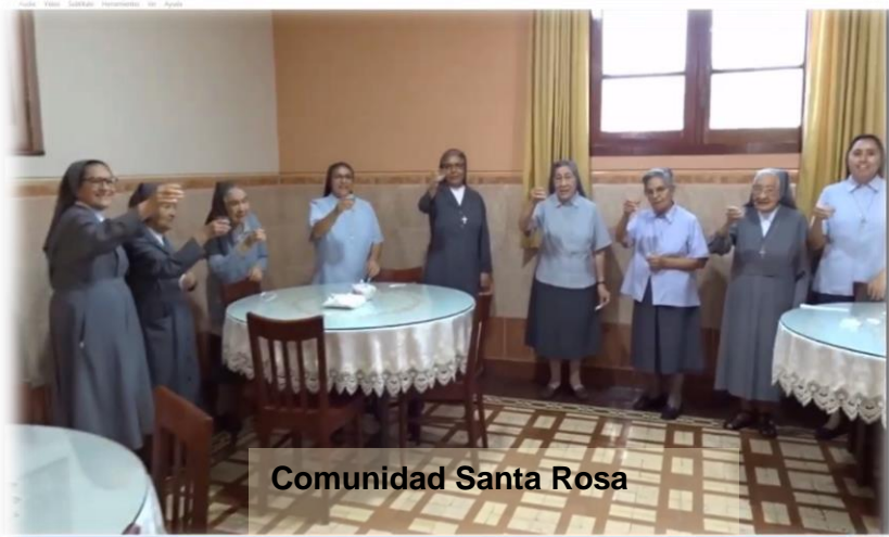
Comunidad Santa Rosa

Luego de la oración y las palabras de la Madre, las Comunidades iniciaron un sencillo compartir de augurios pascuales.