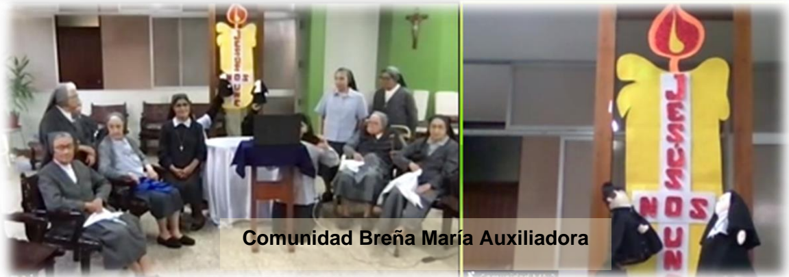
Comunidad Breña María Auxiliadora