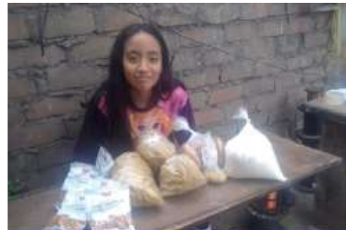
Familias del Colegio

“Dios nunca nos deja”, con esta expresión dicha hoy por una madre de familia, que cuida de sus dos hijas y que está superando el COVID 19, compartimos con sencillez y gratitud, lo que Dios viene haciendo a través de nuestra Comunidad de Barrios Altos en esta situación de tanta necesidad e incertidumbre, sobre todo para los más frágiles de nuestra sociedad.