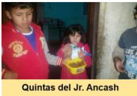
Quintas del Jr. Ancash