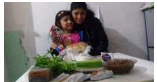
Familia de la Casa de la Felicidad

Por un tema de seguridad sanitaria, se ha organizado de tal modo que se llega, a través de 5 madres de familias del Colegio, del Oratorio y de las Juntas Vecinales, a distintas zonas del barrio: Centro Escolar, Huari, Ancash, Maynas, Teniente Rodríguez, Junín, AAHH Rosa de Santa María