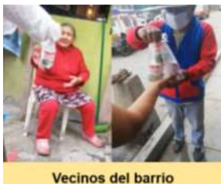
Vecinos del barrio