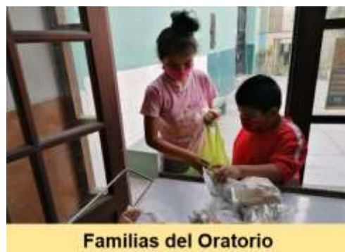
Familias del Oratorio