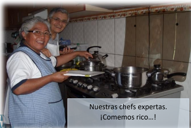
Nuestras chefs expertas. ¡Comemos rico...!

Así, no tenemos tiempo para “aburrirnos”, sino que, al contrario, apreciamos todo cuanto hace nuestro personal y les estamos agradecidos. Aquí van dos fotografías de muestrario. S. Ángela