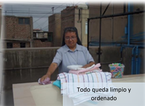
Todo queda limpio y ordenado