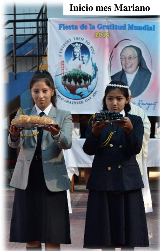
Inicio mes Mariano