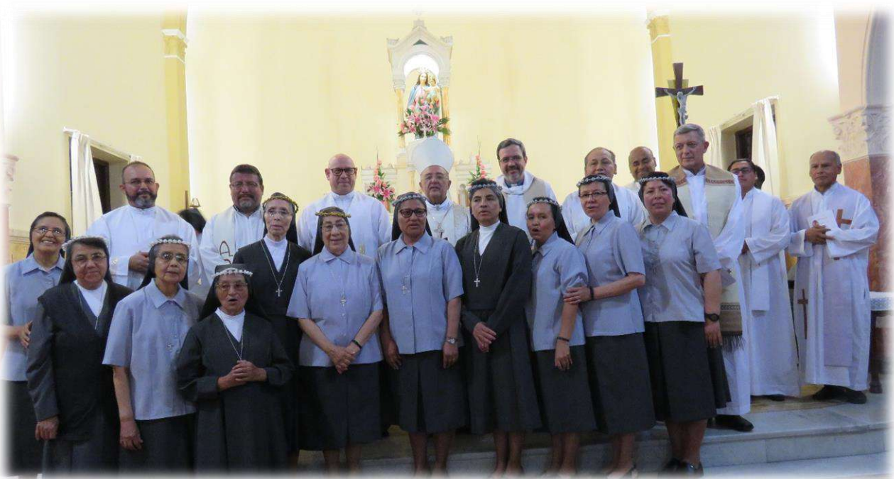
ENCUENTRO DE EXALUMNAS