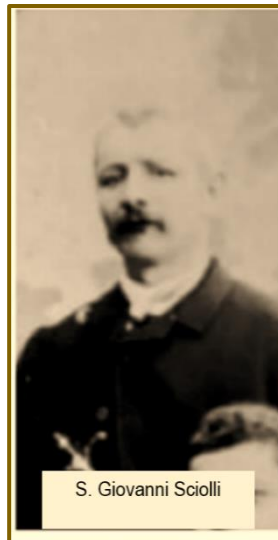
S. Giovanni Sciogli